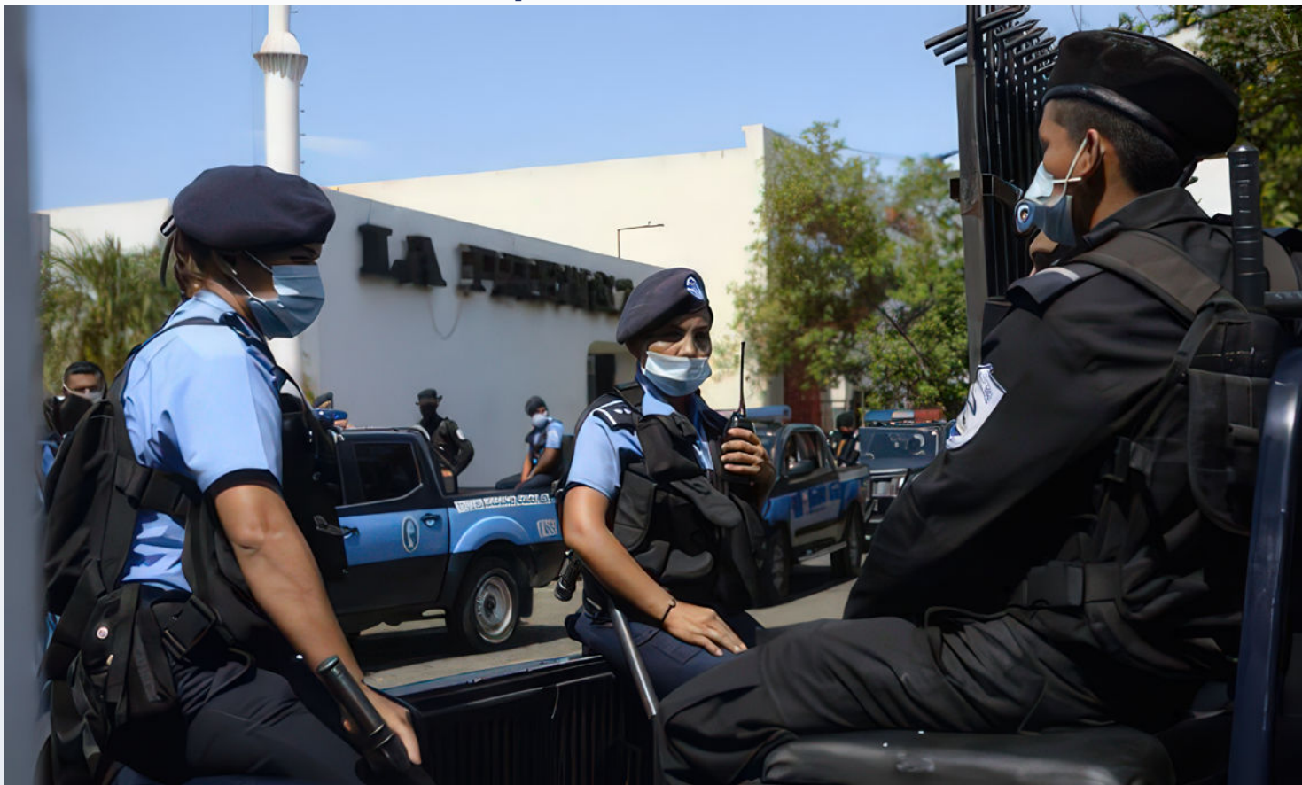
Patrullas de la policía de Nicaragua durante la toma de las instalaciones de La Prensa en agosto 2021.